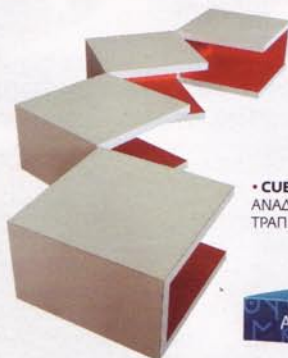
• CUBE ΑΝΑΔΙΠΛΟΥΜΕΝΟ ΤΡΑΠΕΖΙ