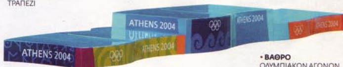
• ΒΑΘΡΟ ΟΛΥΜΠΙΑΚΩΝ ΑΓΩΝΩΝ

Συνεργάστηκε με τον Karim Rashid για πελάτες όπως η PRADA, το όνομά του έχει φιγουράρει στα πιο γνωστά ξένα περιοδικά όπως τα «I-D» και «WALLPAPER», σχεδίασε τα βάρθρα των Ολυμπιακών και Παραολυμπιακών Αγώνων του 2004. Κινείται μεταξύ Γενεύης και Αθήνας όπου δραστηριοποιείται μέσω του γραφείου του chd.