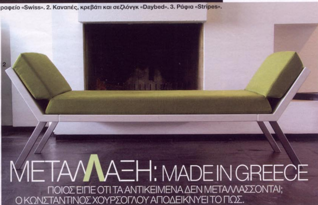
1. Πολυλεπουργικό γραφείο «Swiss». 2. Καναπές, κρεβάτι και σεζλόγκ «Daybed». 3. Ράφια «Stripes».